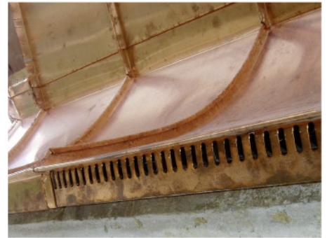
Frische Luft: Trauf- und Abschlussdetail mit ausgeklügelter Lüftungsöffnung