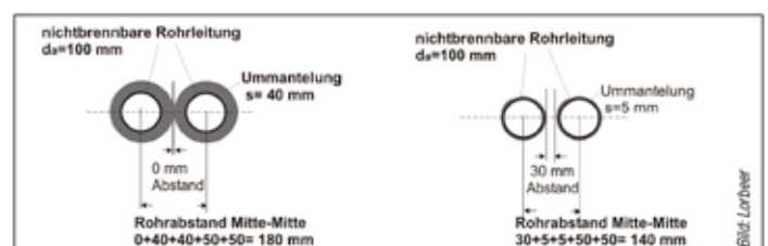
Bild 3 Null-Abstand und trotzdem mehr Platzbedarf.