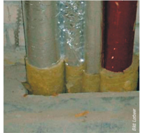
Bild 1 Links: Rohrleitungen im Null-Abstand. Wie soll hier eine Schalung erfolgen? Wie kann ein vernünftiger Deckenverguss eingebracht werden? Wie soll die geforderte Deckenhöhe eingehalten werden, wenn brennbarer Bauschaum den Raum ausfüllt? Rechts: Rohrleitungen in einer Reihe. Wie soll der Betonverguss hinter die Rohrleitungen gelangen?

Brandschutzdurchführungen mit „Null-Abstand“ gelten als Sorgloslösung. Brandschutzgutachtern treiben sie allerdings immer häufiger Sorgenfalten auf die Stirn: Oft sehen die Ausführungen in der Praxis durch falsch verstandene Freiheiten eher aus wie Null-Nachgedacht und nicht wie fachgerechter Brandschutz. Zudem gibt es häufig platzsparendere Varianten.